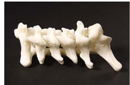
脊椎 3D モデル