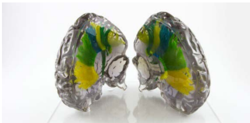
脳 3D モデル

また、本年は旗艦製品である Mimics Innovation Suite の今夏のバージョンアップ情報の一部を紹介しております。繰り返し作業の多い研究者には魅力的な機能です。是非ともブースでご確認ください。